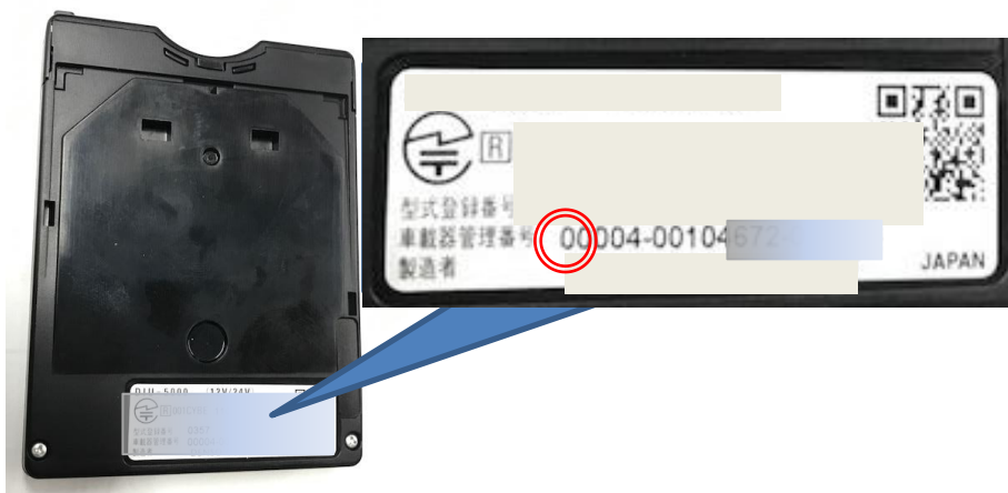
(写真): 旧セキュリティ対応車載器